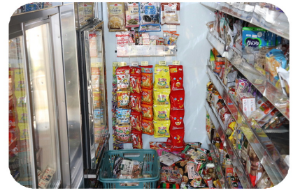
2トラックに食品・日用品がいっぱい