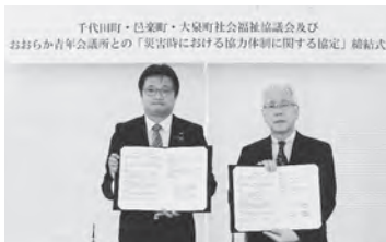
千代田町・邑楽町・大泉町社会福祉協議会及び おおらか青年会議所との「災害時における協力体制に関する協定」締結式