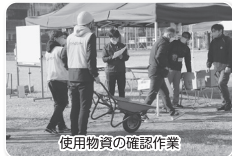
使用物資の確認作業