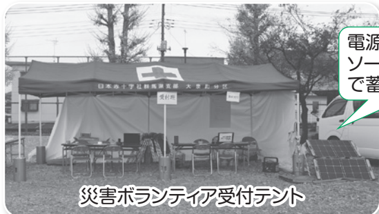
災害ボランティア受付テント

また、関係機関との連携を目的とし、群馬県社協、太田市社協及びおおらか青年会議所にも協力いただきました。訓練を経て気づいた点や課題等を全体で共有し、いつ起きるか分からない災害に活かせるよう備えていきます。