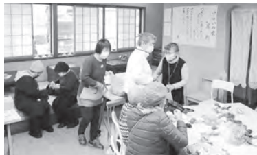
脳トレや編み物などをしながらお喋りを楽しんでいます。子どもから高齢者、あらゆる世代で利用していただきたいです。