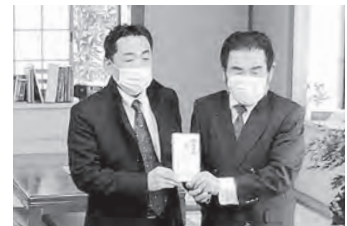
先日、株式会社スター交通様より、「運営にお役立てください」と多大なるご厚意をいただきました。心より感謝申し上げます。