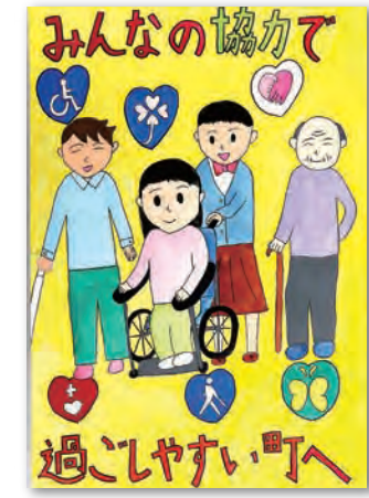
最優秀 「みんなの協力で過こしやさい町へ」