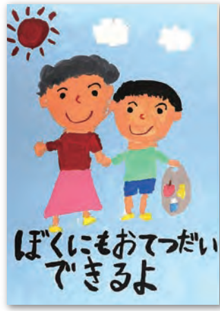
最優秀 「ぼくにもおてつだいできるよ」